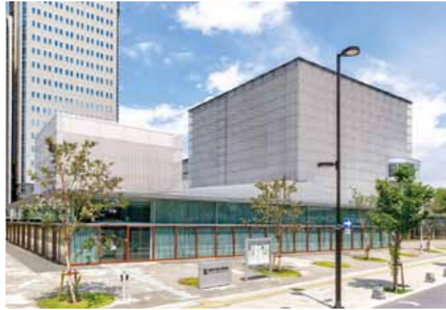
静岡市歴史博物館