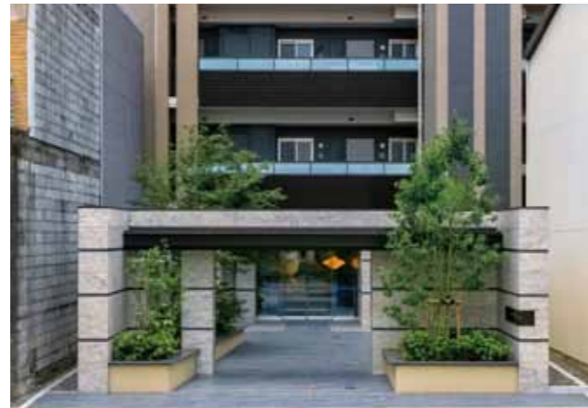
マンション(レーベン葵人宿町 CROSS COURT)