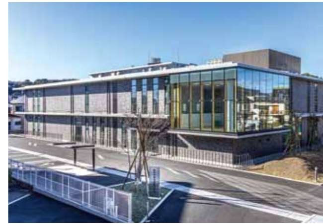
静岡市環境保健研究所