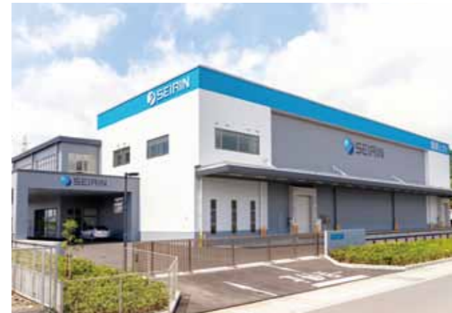
セイリン株式会社 新社屋