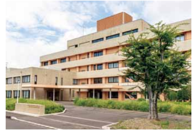
静岡社会健康医学大学院大学