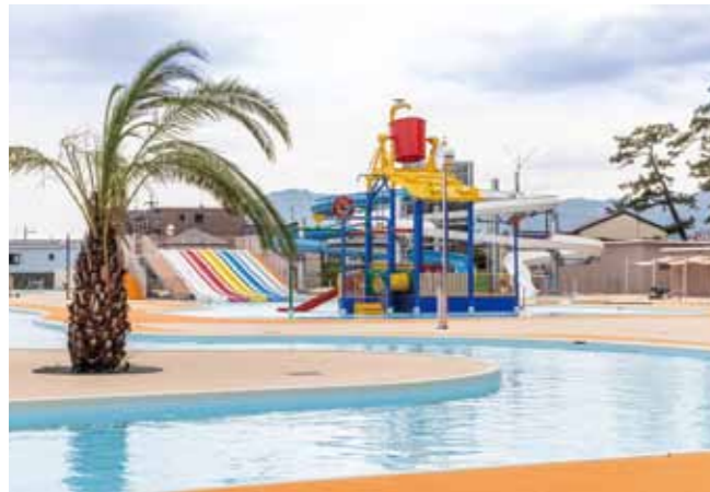
静岡市大浜公園プール